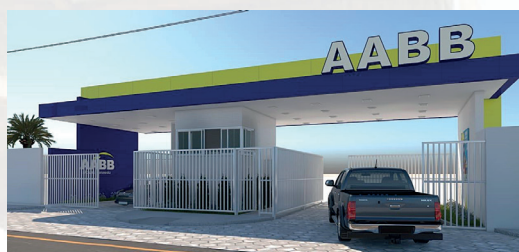
Entrada do portão principal