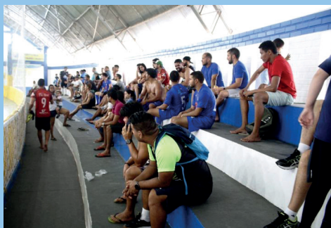
Galera sempre presente aos jogos do Futsal