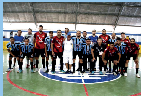
Equipes em ação na abertura do torneio

Um fato inusitado e jamais visto não só em nosso país, mas no mundo inteiro, que foi o surgimento de um vírus letal de nome Coronavírus (Covid-19). Uma pandemia que se alastrou pelo mundo inteiro, está matando