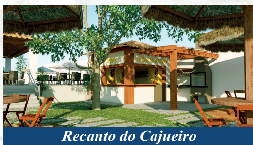
Recanto do Cajueiro