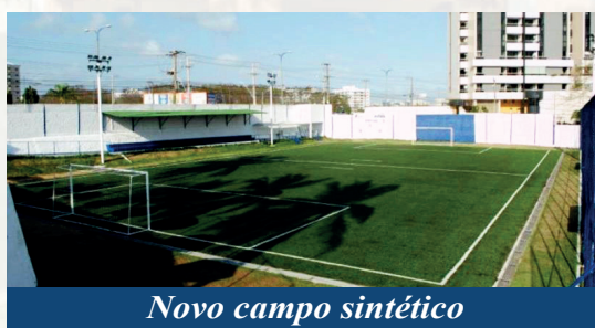
Novo campo sintético

Tão logo foi debelada a famigerada pandemia do Coronavírus