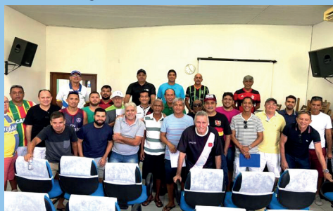
Representantes de equipes no Congresso Técnico que definiu a Copa