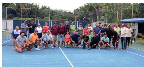
Atletas participantes do Torneio de Tênis