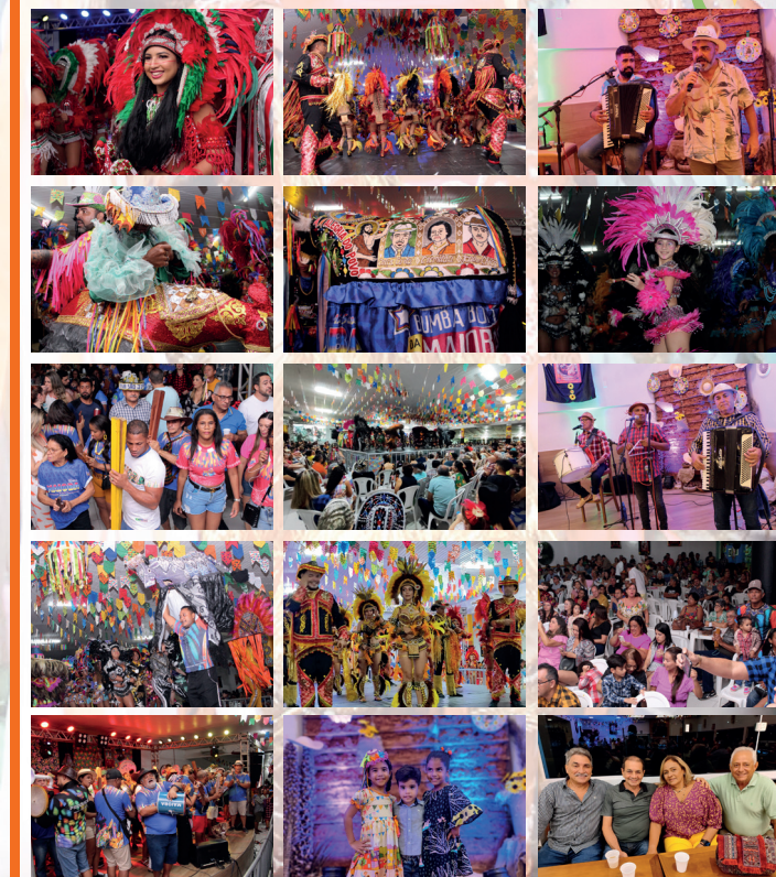
Momentos marcantes e de muita animação, na sede da AABB São Luís, por conta da realização de mais um brilhante São João Ouro