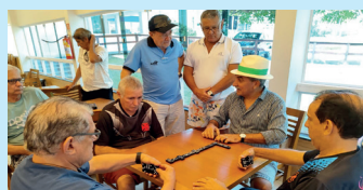
Momento decisivo da partida entre as duplas