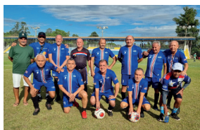
Equipe Supermaster (+ 60)