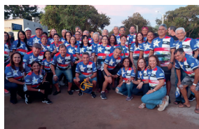
Delegação abebeana de São Luís