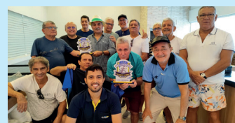
Participantes do I Torneio de Dominó

A Associação Atlética Banco do Brasil (AABB São Luís) realizou, pela primeira vez e de maneira oficial, no salão principal, um Torneio de Dominó com a participação efetiva de sócios do clube. Nesse par-