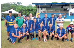
Equipe Hipermaster (+ 65)