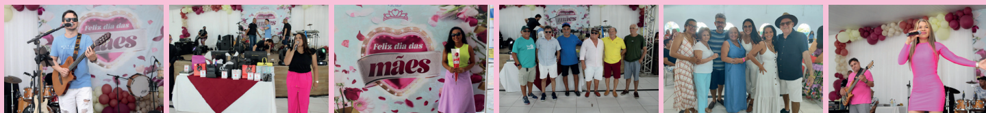
Sede da AABB São Luís esteve bastante movimentada, nas comemorações alusivas ao Dia das Mães