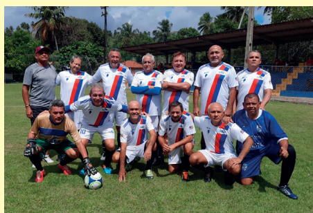
Futebol Supermaster (+60) – Campeão na Jinfaabb