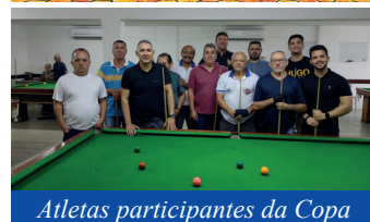
Atletas participantes da Copa