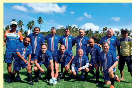
Futebol Hipermaster (+65) – Vice-campeão na Jinfaabb