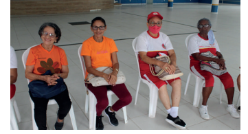
Idosos do Programa Alegria de Viver participaram de várias atividades recreativas na sede da AABB São Luís

Mais um grande gesto de solidariedade humana realizado pela direção da Associação Atlética Banco do Brasil! No dia 17 de março deste ano, a AABB São Luís, em parceria com o Batalhão de Bombeiros Marítimo