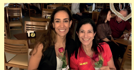
Sede da AABB São Luís esteve bastante movimentada, por conta das comemorações alusivas ao Dia Internacional das Mulheres