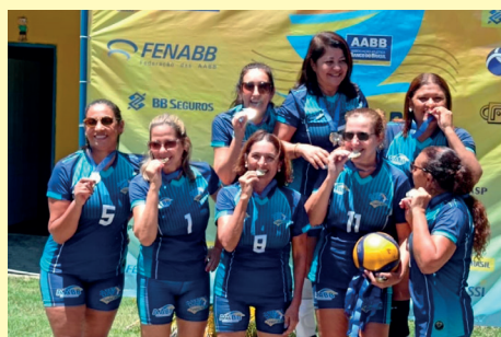
Voleibol Feminino – Equipe Campeã na Jinfaabb