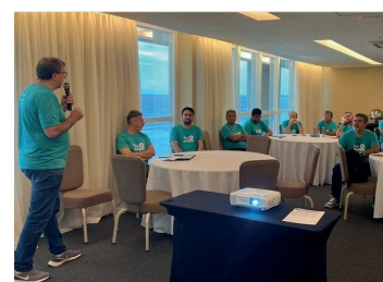
Dirigentes da AABB e da Fenabb na abertura do Programa Pensaabb