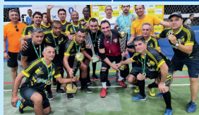
Campeão Supermaster - Apocalipse