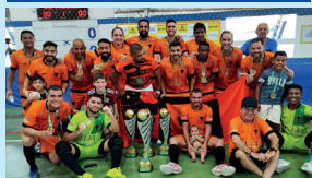
Campeão Master - Apal