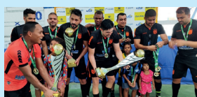
Campeão Efetivo - Zero Um 39