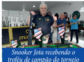
Snooker Jota recebendo o troféu de campeão do torneio