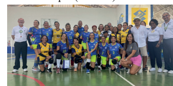
Dirigentes e atletas presentes ao evento

ficadora Pão Já, Danitê Acessórios, Banho de Chá, Recortes e Detalhes, Shopping dos Cosméticos, Itch Informática e Liga Acadêmica Esportiva de Fisioterapia (LAESF).