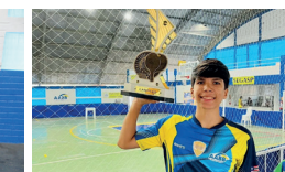
Destaque do tênis de mesa, na 5ª etapa do campeonato estadual, realizado na sede da AABB São Luís