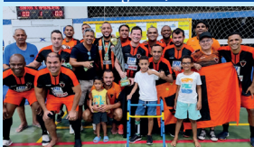
Campeão Senior - Apal