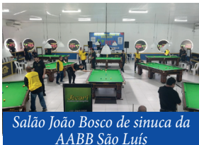
Salão João Bosco de sinuca da AABB São Luís