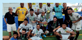
Campeão Adulto - Major