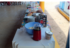
Idosos do Programa Social Alegria de Viver tiveram um dia muito especial na sede na AABB São Luís

Mais um grande gesto de solidariedade humana realizado pela direção da AABB São Luís em parceria com o Batalhão de Bombeiros Marítimos (BBMAR) e com o Corpo de