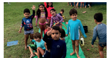
Várias atividades recreativas e lúdicas foram oferecidas na Colônia de Férias da AABB São Luís em parceria com a empresa Fazendo Arte Recreação

Esse tradicional e festivo evento, que já faz parte do calendário oficial do clube, já é uma tradição nos meses de janeiro e julho. Nesses dois meses do ano, a AABB São Luís promove a sua tradicional Colônia de Férias em parceria com a empresa Fa-