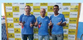
Apresentadores do programa de TV Planeta Esportivo