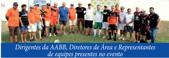
Dirigentes da AABB, Diretores de Área e Representantes de equipes presentes no evento