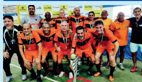
Campeão Hipermaster - Apal