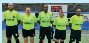
Equipe de Arbitragem da Federação Maranhense de Futsal