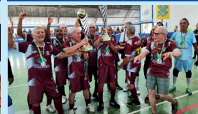
Campeão Ultramaster - Americano