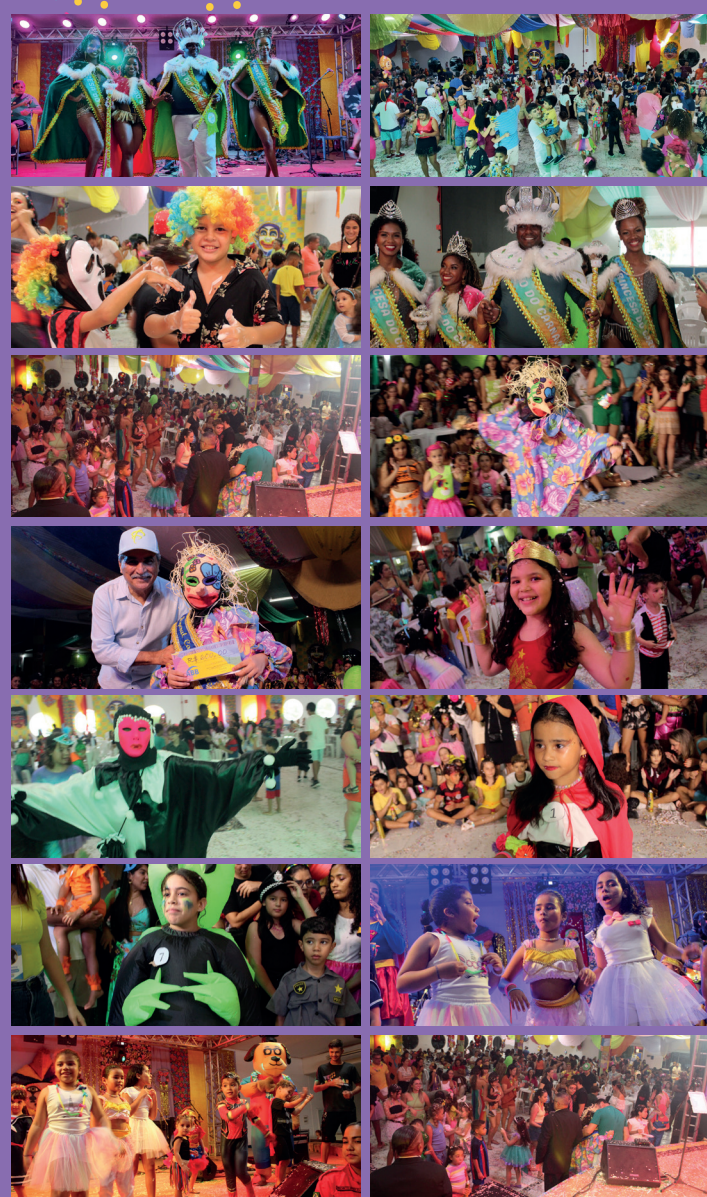
Vesperais Carnavalescos da AABB São Luís superaram todas as expectativas