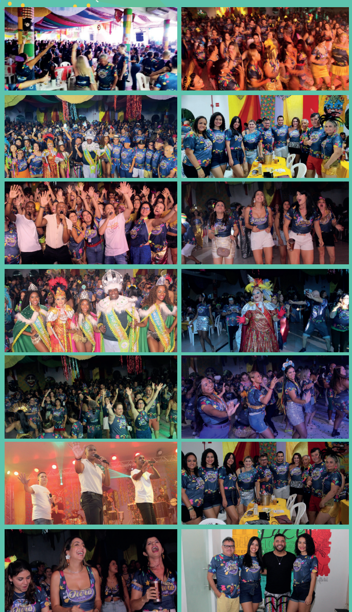
Baile Ouro já é uma marca registrada do carnaval abebeano