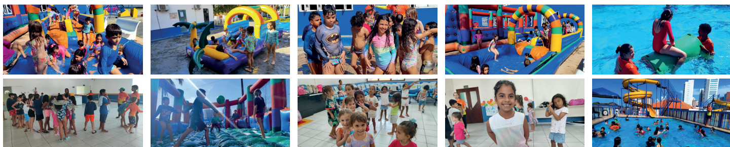
Garotada, das diversas faixas etárias, viveu momentos inesquecíveis em mais uma Colônia de Férias

tico. Tudo era festa e muita diversão para a garotada das diversas faixas etárias presentes. Foram brincadeiras recreativas e lúdicas, gincanas, atividades musicais, jogos dos cinco continentes, entre outras atividades.