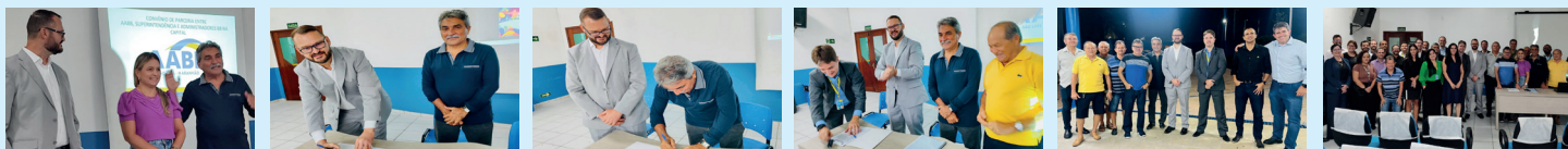
Dirigentes da AABB e do BB, na sede da Associação, no momento da assinatura do termo de cooperação

No dia 30 de janeiro deste ano, a Associação Atlética Banco do Brasil (AABB São Luís) e a Superintendência de Varejo do Banco do Brasil e Administradores do BB em nossa capital, celebraram termo de cooperação. O importante convênio, tem por objetivo estabelecer condições especiais para o ingresso de clientes do Banco do Brasil no quadro de associados da AABB São Luís, na condição de sócio comunitário, os quais serão devidamente registrados, na forma do Estatuto Social e Norma-