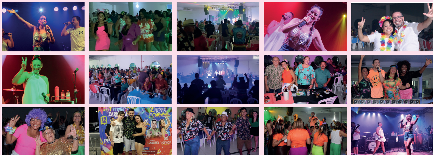
Muita animação e alegria nas prévias carnavalescas realizadas pela direção da AABB São Luís