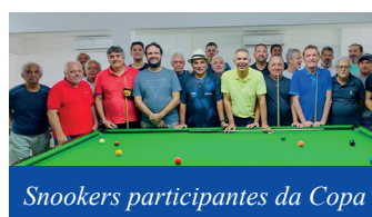
Snookers participantes da Copa