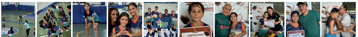
LG3 Esporte e Saúde realiza Festival do Chocolate na sede da AABB São Luís

miações com medalhas de chocolate para os atletas participantes. Vale lembrar que esse evento é realizado a cada três meses pela LG3 Esporte e Saúde.