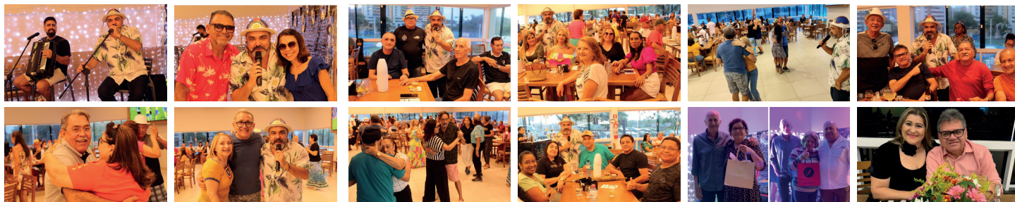
Dois shows memoráveis realizados na sede da AABB São Luís em alusão ao Dia Internacional da Mulher

foi o grupo Forró do Tony, com um repertório bem diversificado que agradou a todos, em apresentação realizada no salão principal do clube.