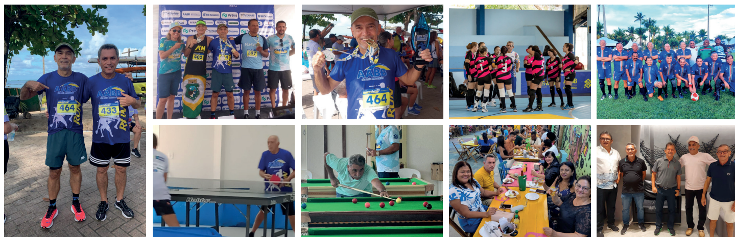
Atletas da delegação abebeana participando com sucesso de mais um Campeonato de Integração dos Funcionários Aposentados do BB

Realizado no período de 17 a 24 de abril deste ano, o maior Campeonato de Integração dos Funcionários do Banco do Brasil (Cinfaabb) reuniu, na capital alagoana de Maceió, na sua 28ª edição, cerca de 3.000 participantes, sendo aproximadamente 1.500 atletas de todo o Brasil.