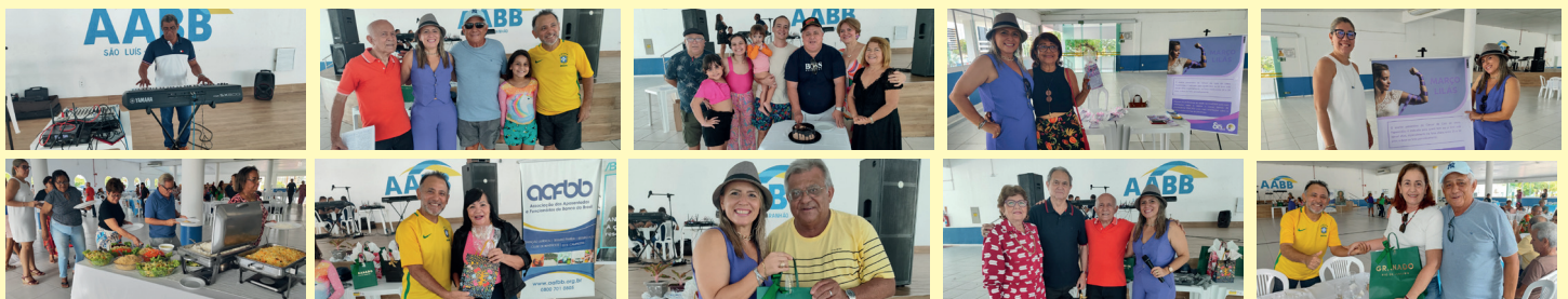
Com promoção da ANABB e apoio e organização da AABB São Luís, aposentados do BB estiveram mais uma vez reunidos na sede da Associação

Ao final do evento, em clima de muita expectativa, ocorreu um sorteio de brindes direcionado para os sócios aposentados presentes.