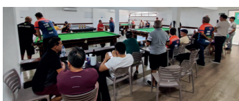
Salão de Jogos João Bosco