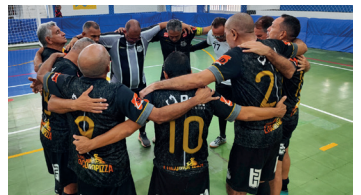
Dirigentes, atletas e equipe de arbitragem na solenidade de abertura da Copa César Bragança de Futsal