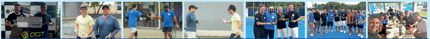
Atletas de Tênis de Quadra vencedores da 1ª Etapa do SV OPEN recebem premiação em churrasco de comemoração

Entre os dias 04 e 07 de abril deste ano, foi realizada, com muito sucesso, no Sports Village, a 1ª Etapa do SV Open de Tênis de Duplas/2024. Os destaques desse torneio foram os atletas associados